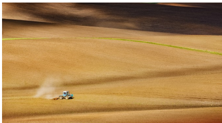
Tracteur dans un champ ukrainien

L'Ukraine est le grain à blé de l'occident. La Russie et la Chine sont des concurrents pour les États-Unis et surtout la finance qui veut diviser pour régner. Viktor Ianoukovytch est déstabilisé par la CIA en 2013 finançant les nazis et des manifestants alors armés.